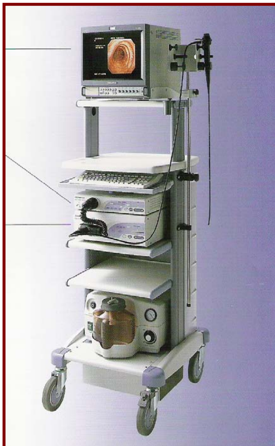
Πύργος εύκαμπτης βρογχοσκόπησης με συνδεδεμένο εύκαμπτο παιδιατρικό βρογχοσκόπιο