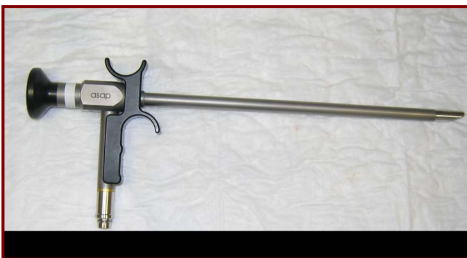
Άκαμπτο παιδιατρικό βρογχοσκόπιο

Η βρογχοσκόπηση με το άκαμπτο βρογχοσκόπιο που είναι ειδικός άκαμπτος μεταλλικός σωλήνας. Μέσα από αυτό το σωλήνα βλέπουμε και κάνουμε ειδικές επεμβάσεις. Το άκαμπτο βρογχοσκόπιο χρησιμοποιείται κυρίως από τους Ωτορινολαρυγγολόγους και τους Παιδοχειρουργούς.